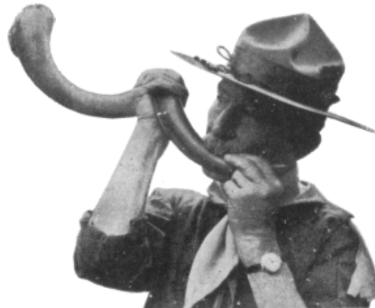
The Kudu Horn

El primer libro Guía se llamó: "Cómo las muchachas pueden ayudar a construir el Imperio". Fue escrito por la hermana del Jefe, quien tomó gran interés en el Movimiento Guía. Es un libro espléndido y todavía existen algunas copias. Contiene muchas ideas que son hoy en día tan útiles como lo fueron cuando fue escrito, hace muchos años. Pero "Escultismo para Muchachos" fue el primer gran libro, y cualquiera que trata de ser Guía o Scout sin él, va derecho al fracaso. Si leen cuidadosamente Escultismo para Muchachos, verán que el Jefe no inventó el Escultismo, sino que de las románticas y aventureras ideas del mundo y de sus grandes ideales, tomó todo aquello que con más seguridad ayudaría a un muchacho o muchacha, a un hombre o a una mujer, a caminar por la senda recta y a ser feliz.