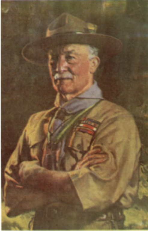
El Jefe Scout del Mundo del cuadro de David Jagger